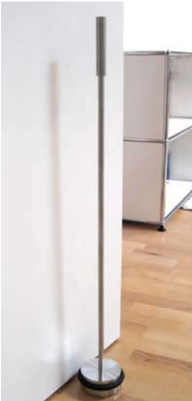
TSB 90-45 G

! Individuelle Ausführung in Höhe und Gewicht auf Anfrage.