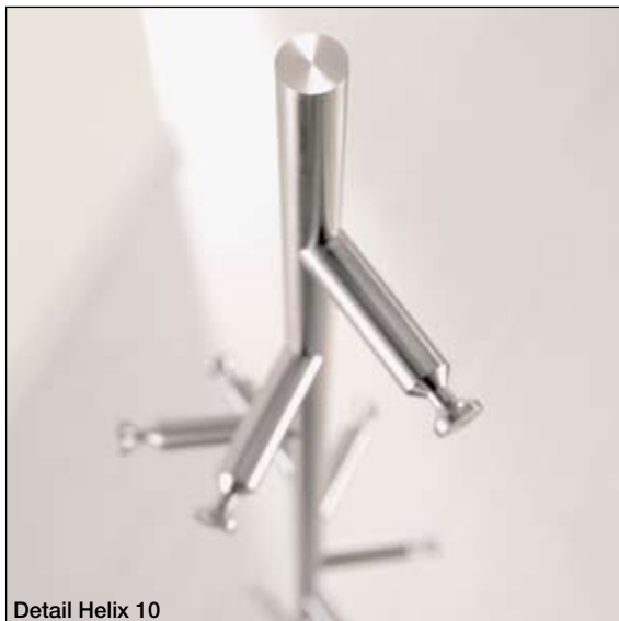
Detail Helix 10