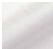
L000 – Hellweiß