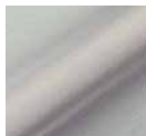
L060 – Hellgrau