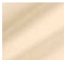
L011 – Hellbeige