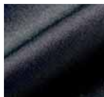
L061 – Anthrazit