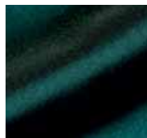
L051 – Meergrün