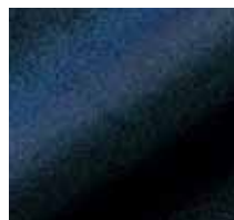
L071 – Nachtblau