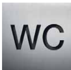
BS0101 – 160x160 mm

Edelstahl, vertikal matt gebürstet, gelasert und feinbearbeitet. Selbstklebend, stark haftend (Reinacrylat), Materialstärke 2 mm, Schrift: Helvetica Neue LT Medium. Größenangabe in HxB. Optionale Befestigungsmöglichkeiten und Hintergrundfolie siehe S. 266.