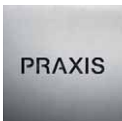
BS0601 – 160x160 mm