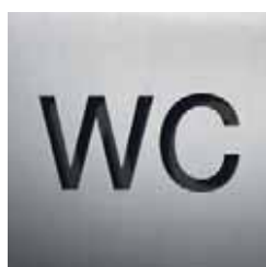
BS0101 – 160x160 mm

Edelstahl, vertikal matt gebürstet, gelasert und feinbearbeitet. Selbstklebend, stark haftend (Reinacrylat), Materialstärke 2 mm, Schrift: Helvetica Neue LT Medium. Größenangabe in HxB. Optionale Befestigungsmöglichkeiten und Hintergrundfolie siehe S. 266.