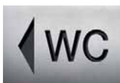
BS0103 – 160x235 mm