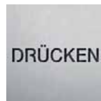
BS0902 – 100x100 mm