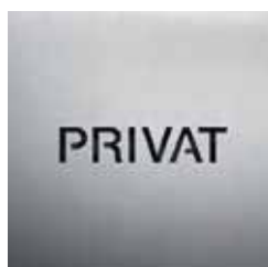
BS0701 – 160x160 mm