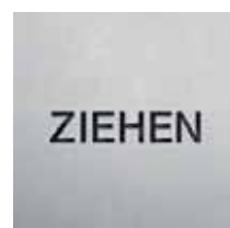
BS0802 – 100x100 mm