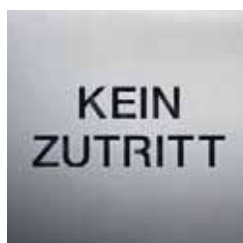
BS0401 – 160x160 mm