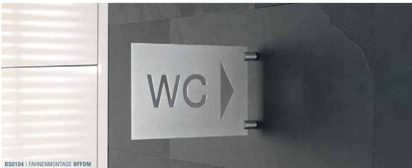
BS0104 | FAHNENMONTAGE BFFDM

Individuelle Maße erhältlich Verwendung individueller Schrifttypen nach Vorgabe Bezüglich des Diebstahlschutzes im öffentlichen Bereich empfehlen wir die Befestigung mittels Heißkleber oder Silikon