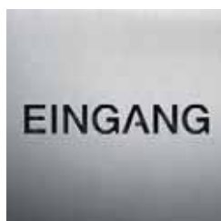
BS0201 – 160x160 mm