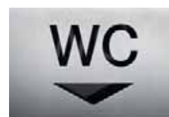
BS0106 – 160x235 mm