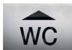
BS0105 – 160x235 mm