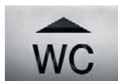
BS0105 – 160x235 mm