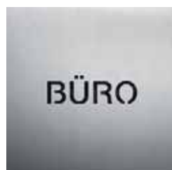
BS0501 – 160x160 mm