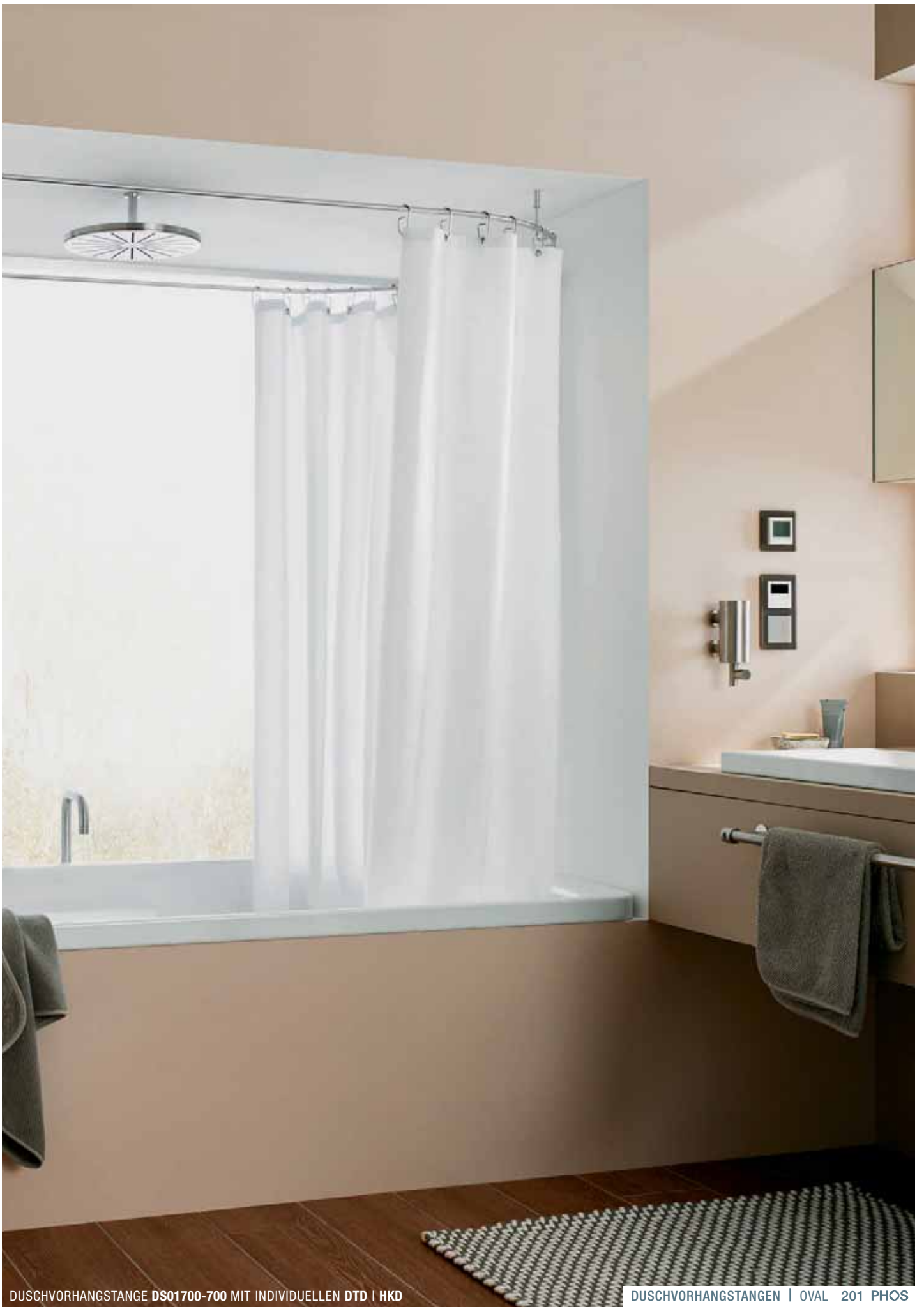
DUSCHVORHANGSTANGE DS01700-700 MIT INDIVIDUELLEN DTD | HKD