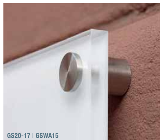
GS20-17 | GSWA15

Inklusive Montagematerial Individuelle Glasscheiben auf Anfrage erhältlich Spiegelhalter siehe S. 148 Edelstahlreiniger siehe S. 292