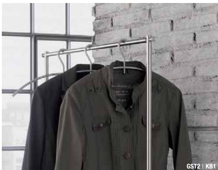
GST2 | KB1