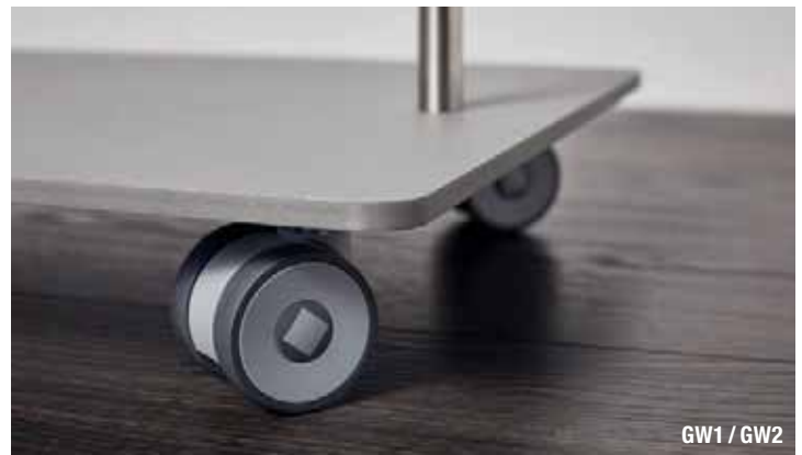
GW1 / GW2