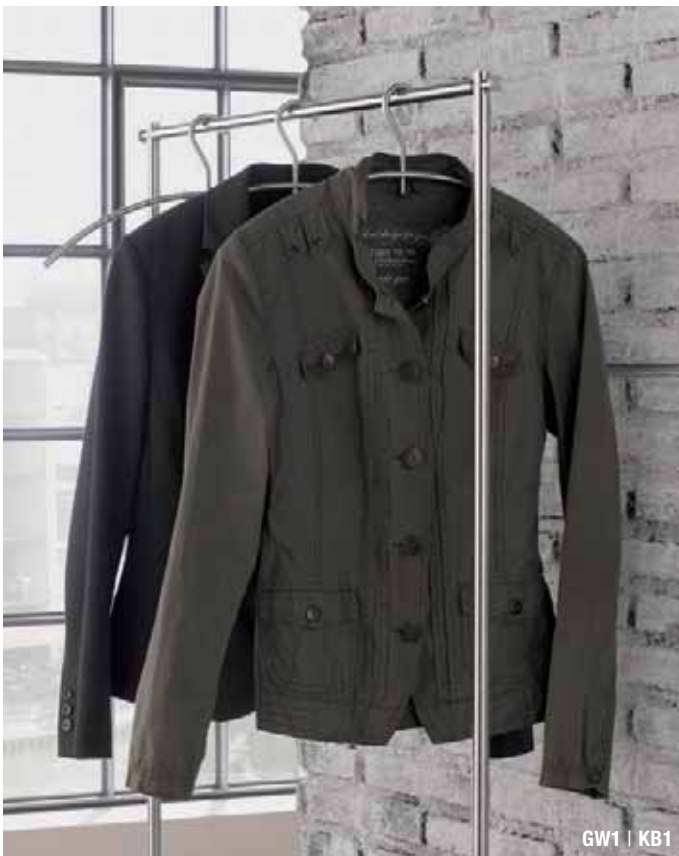
GW1 | KB1