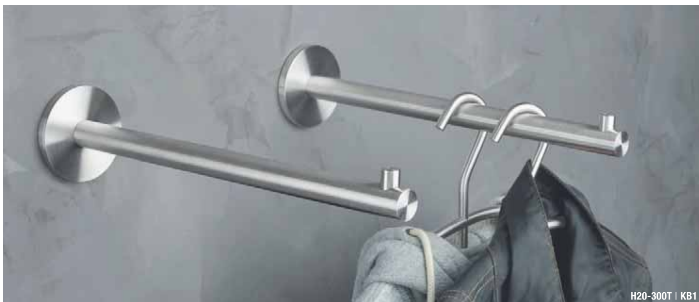
H20-300T | KB1