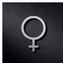
P2601 – 118 x 80 mm