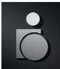
P0501 – 110 x 70 mm