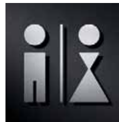
P0201 – 110 x 119 mm