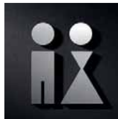
P0101 – 110 x 95 mm