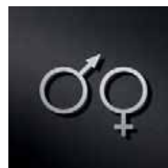
P2701 – 105 x 134 mm

In individuellen Größen erhältlich Passende Beschriftungen wie H, D, WC, siehe S. 261 Bezüglich des Diebstahlschutzes im öffentlichen Bereich empfehlen wir die Befestigung mittels Heißkleber oder Silikon Edelstahlreiniger siehe S. 292