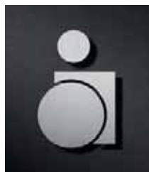
P0601 – 110 x 70 mm