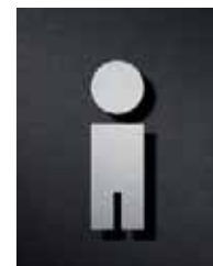
P0901 – 95 x 30 mm