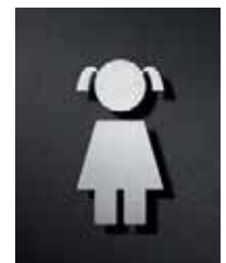
P1001 – 95 x 51 mm