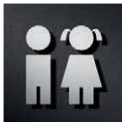
P0701 – 95 x 93 mm