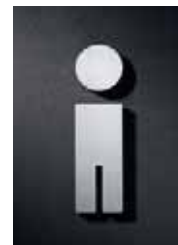
P0301 – 110 x 30 mm