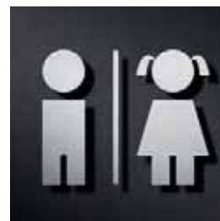
P0801 – 95 x 108 mm