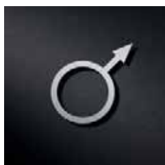
P2501 – 103 x 103 mm