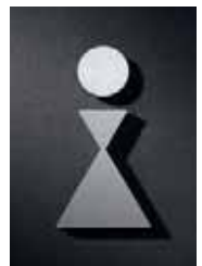
P0401 – 110 x 55 mm