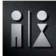
P0201 – 110 x 119 mm