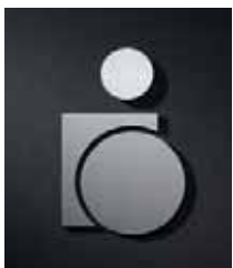
P0501 – 110 x 70 mm