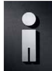
P0301 – 110 x 30 mm