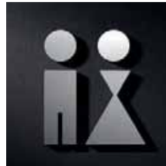
P0101 – 110 x 95 mm