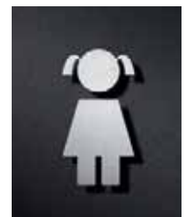
P1001 – 95 x 51 mm