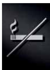
P2901 – 125 x 125 mm