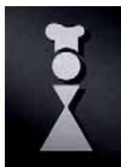
P2401 – 135 x 55 mm