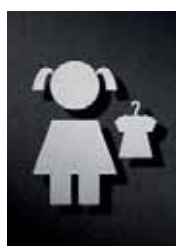
P1801 – 95 x 75 mm