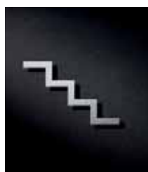
P3101 – 79x117 mm

Ideal zur Kombination mit anderen Piktogrammen