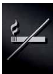
P2901 – 125 x 125 mm