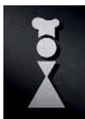
P2401 – 135 x 55 mm