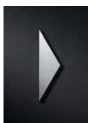
P3501 gedreht 110 x 30 mm

Ideal zur Kombination mit anderen Piktogrammen