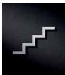
P3201 – 79x117 mm