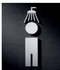
P2001 – 150x35 mm

Edelstahl, vertikal matt gebürstet, gelasert und feinbearbeitet. Selbstklebend, stark haftend (Reinacrylat), Materialstärke 2 mm, Größenangabe in HxB. Design: Andreas Winkler / Thorsten Wohner