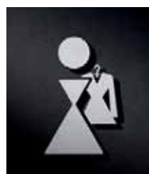
P1401 – 110x69 mm