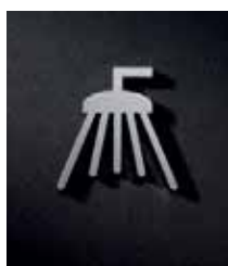
P2201 – 55x50 mm