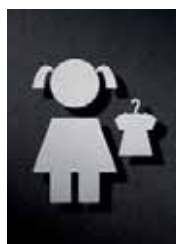
P1801 – 95 x 75 mm