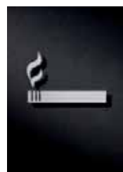
P3001 – 67 x 100 mm