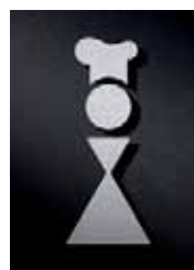
P2401 – 135 x 55 mm