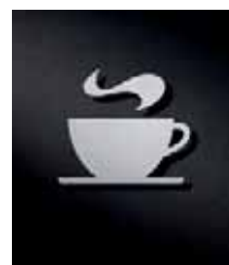
P3701 – 92 x 85 mm