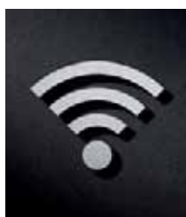
P4101 – 112x91 mm

Ideal zur Kombination mit anderen Piktogrammen