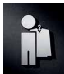
P1301 – 110x65 mm