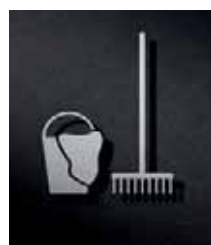
P3801 – 110x96 mm