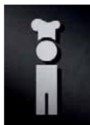
P2301 – 135 x 45 mm