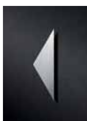
P3501 110 x 30 mm