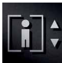
P3301 – 94x130 mm