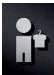
P1701 – 95 x 60 mm