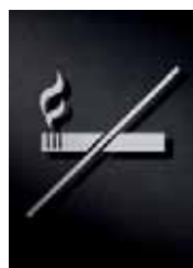
P2901 – 125 x 125 mm