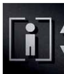
P3301 – 94x130 mm