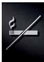
P2901 – 125 x 125 mm