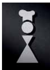
P2401 – 135 x 55 mm