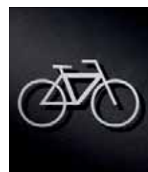
P3401 – 84x150 mm