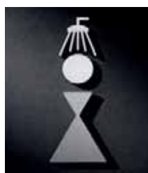
P2101 – 150x55 mm