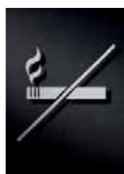
P2901 – 125 x 125 mm