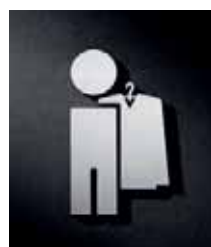
P1301 – 110x65 mm