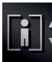
P3301 – 94x130 mm