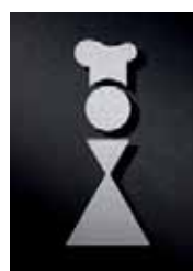
P2401 – 135 x 55 mm