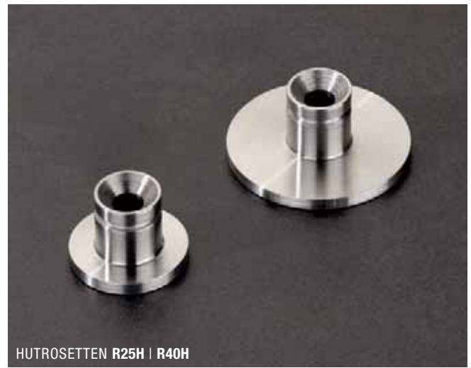
HUTROSETTEN R25H | R40H

Zur Vergrößerung der Auflagefläche mit Haken / Haltern kombinierbar