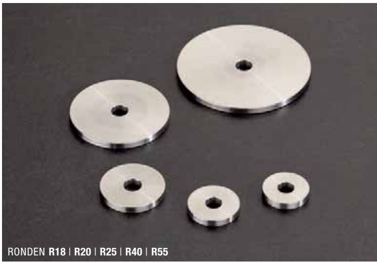
RONDEN R18 | R20 | R25 | R40 | R55