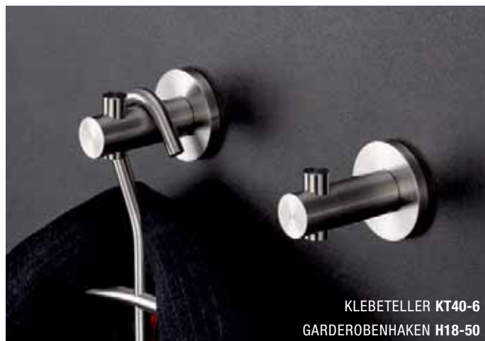
KLEBETELLER KT40-6 GARDEROBENHAKEN H18-50