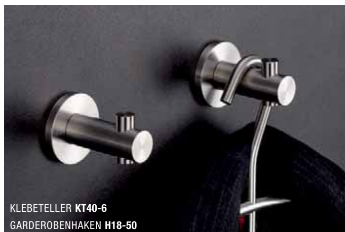
KLEBETELLER KT40-6 GARDEROBENHAKEN H18-50