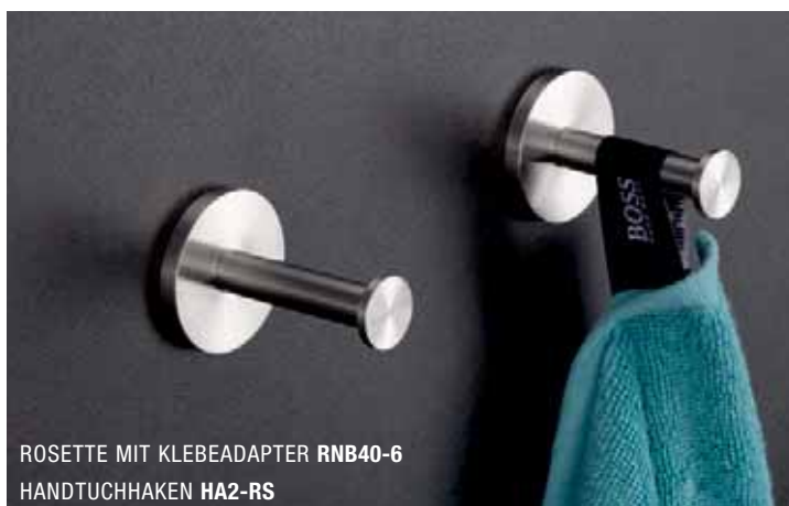
ROSETTE MIT KLEBEADAPTER RNB40-6 HANDTUCHHAKEN HA2-RS