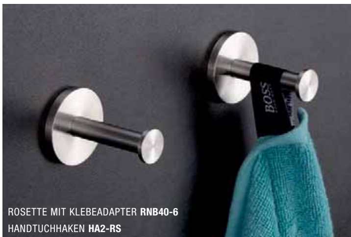
ROSETTE MIT KLEBEADAPTER RNB40-6 HANDTUCHHAKEN HA2-RS