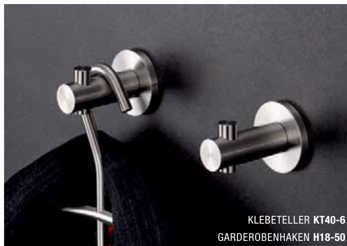
KLEBETELLER KT40-6 GARDEROBENHAKEN H18-50