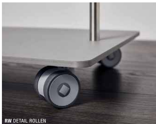
RW DETAIL ROLLEN