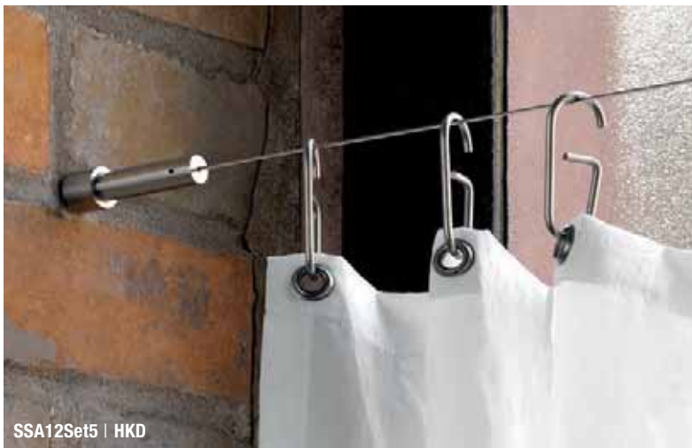
SSA12Set5 | HKD