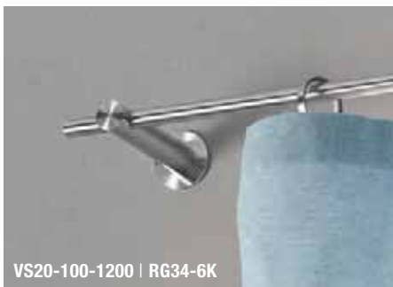
VS20-100-1200 | RG34-6K

Einzelemente und Zubehör für eine individuelle Planung siehe S. 118 ff. Vorhangstangen und -rohre in größeren Durchmessern siehe S. 279 Raffhalter siehe S. 123 Vorhanghaken und -ringe siehe S. 131 Endkappe EK12 siehe S. 290 Inklusive Montagematerial Edelstahlreiniger siehe S. 292