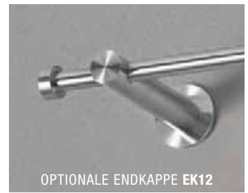
OPTIONALE ENDKAPPE EK12