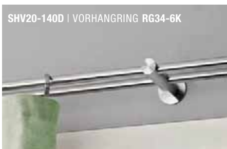
SHV20-140D | VORHANGRING RG34-6K

Einzelemente und Zubehör für eine individuelle Planung siehe S. 118 ff.