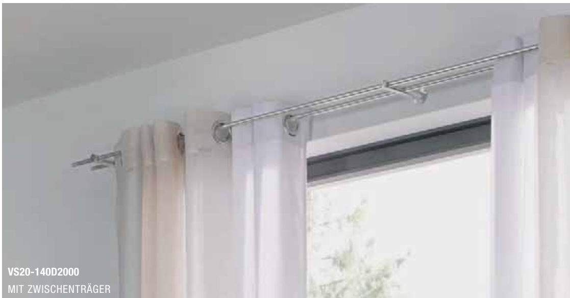
VS20-140D2000 MIT ZWISCHENTRÄGER