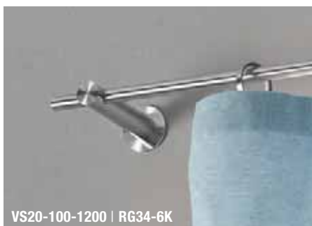
VS20-100-1200 | RG34-6K

Einzelelemente und Zubehör für eine individuelle Planung siehe S. 118 ff. Vorhangstangen und -rohre in größeren Durchmessern siehe S. 279 Raffhalter siehe S. 123 Vorhanghaken und -ringe siehe S. 131 Endkappe EK12 siehe S. 290 Inklusive Montagematerial Edelstahlreiniger siehe S. 292