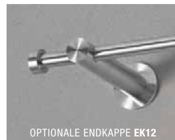
OPTIONALE ENDKAPPE EK12