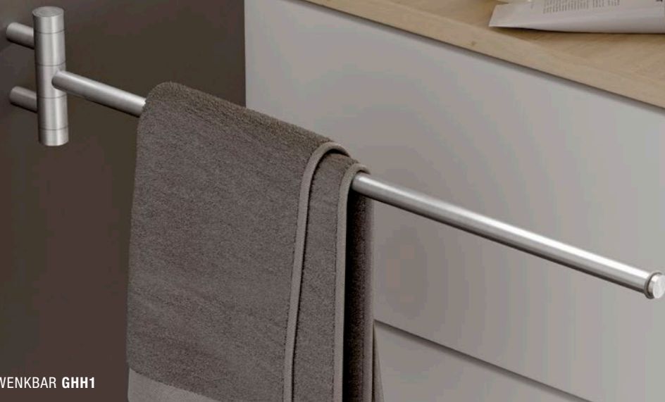
HANDTUCHHALTER SCHWENKBAR GHH1

Inklusive Montagematerial zur Wandverschraubung.