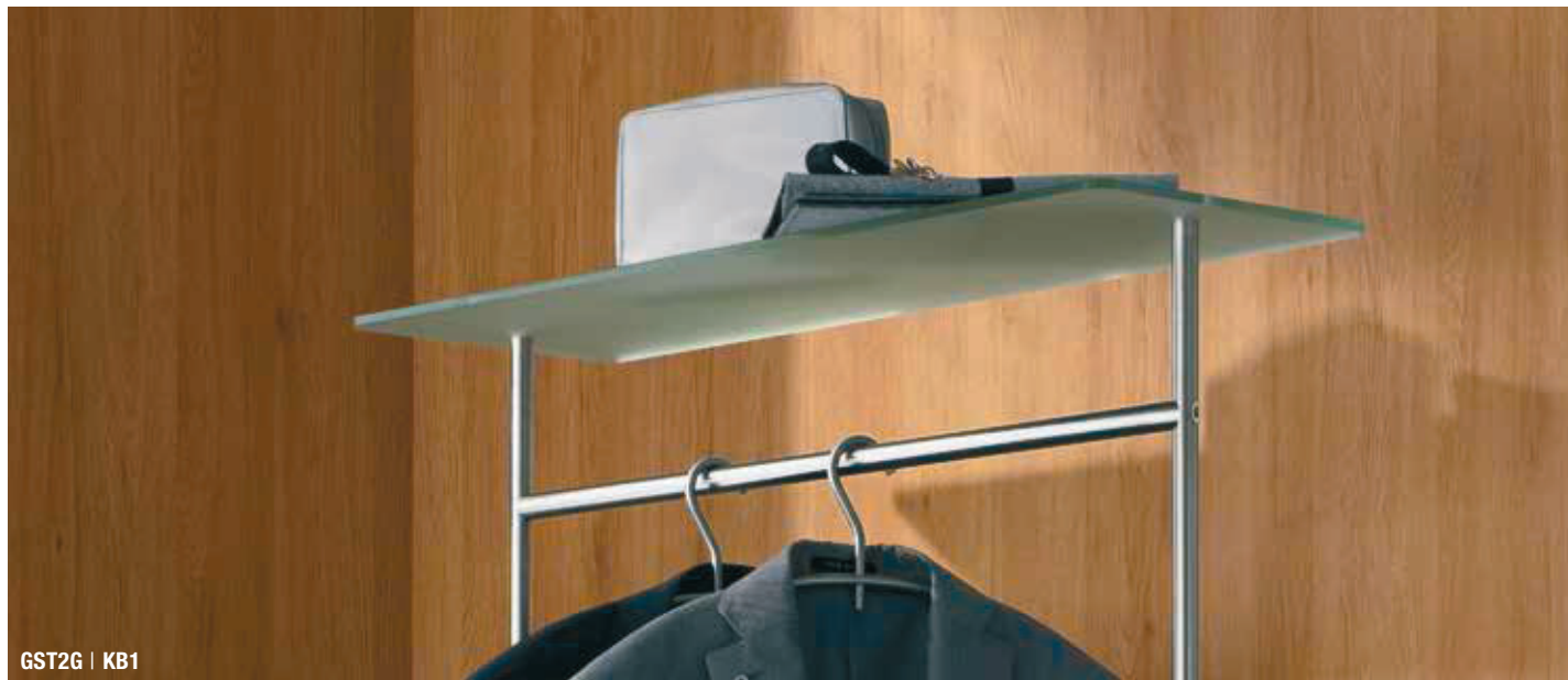
GST2G | KB1