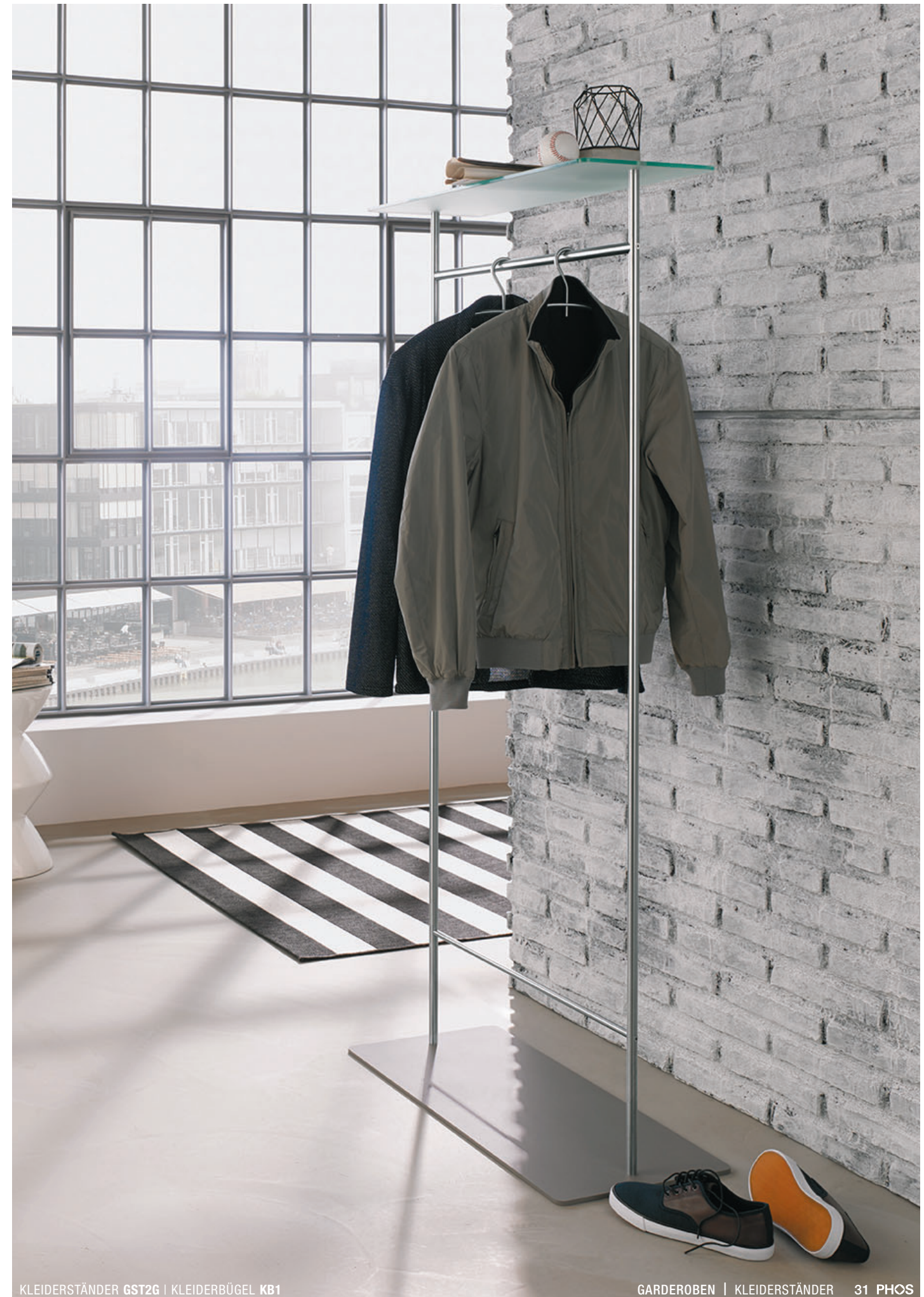
KLEIDERSTÄNDER GST2G | KLEIDERBÜGEL KB1

*Material: Polyurethan. Hohe chemische und thermische Beständigkeit, bei ausgezeichneter Abrieb- und Abscherfestigkeit. **Gewindesicherung über mikroverkapselte Gewindeverklebung.