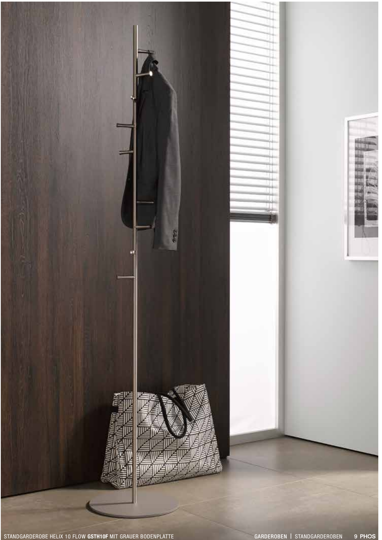
STANDGARDEROBE HELIX 10 FLOW GSTH10F MIT GRAUER BODENPLATTE