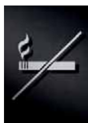
P2901 – 125 x 125 mm