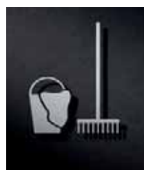
P3801 – 110x96 mm