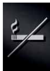
P2901 – 125 x 125 mm