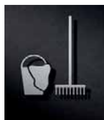
P3801 – 110x96 mm