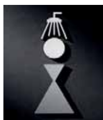
P2101 – 150x55 mm