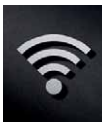
P4101 – 112x91 mm

Ideal zur Kombination mit anderen Piktogrammen