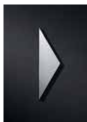
P3501 gedreht 110 x 30 mm

Ideal zur Kombination mit anderen Piktogrammen