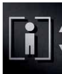
P3301 – 94x130 mm