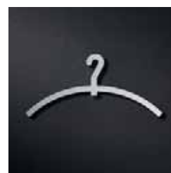
P1901 – 44x90 mm