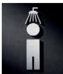
P2001 – 150x35 mm

Edelstahl, vertikal matt gebürstet, gelasert und feinbearbeitet. Selbstklebend, stark haftend (Reinacrylat), Materialstärke 2 mm, Größenangabe in HxB. Design: Andreas Winkler / Thorsten Wohner