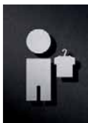
P1701 – 95 x 60 mm