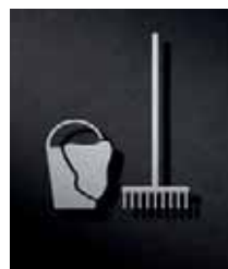
P3801 – 110x96 mm