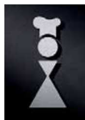
P2401 – 135 x 55 mm