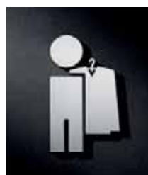
P1301 – 110x65 mm