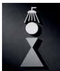
P2101 – 150x55 mm