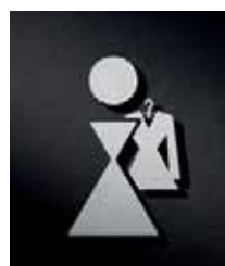
P1401 – 110x69 mm