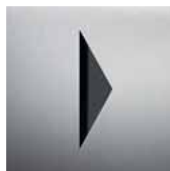
PS3501 – GEDREHT

Ideal zur Kombination mit anderen Piktogrammen