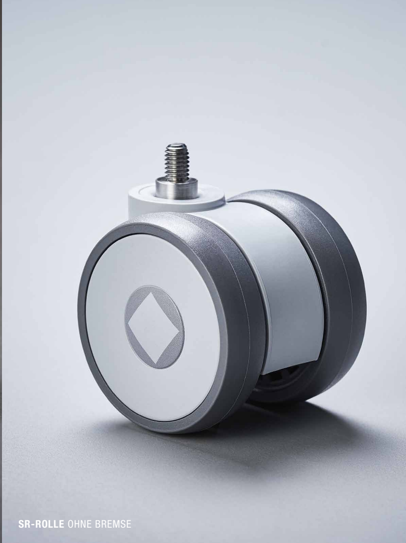
SR-ROLLE OHNE BREMSE