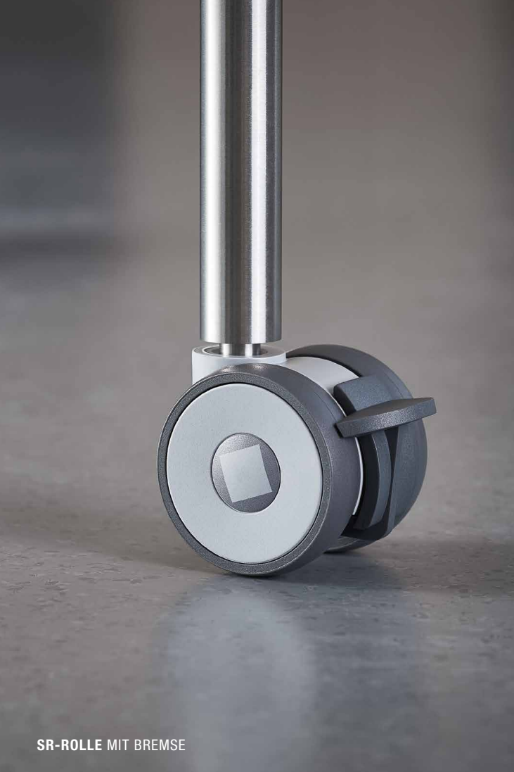
SR-ROLLE MIT BREMSE