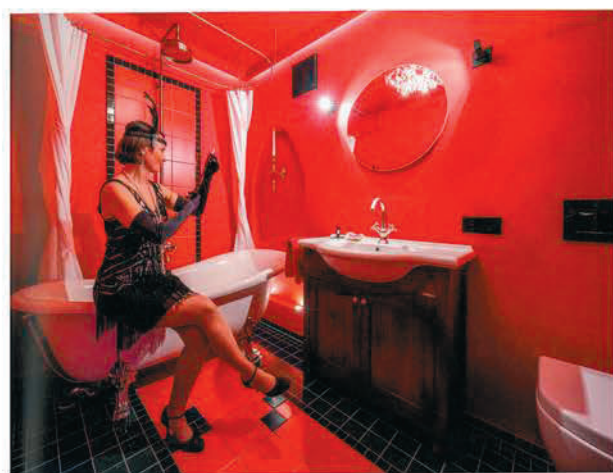
Laszives, verführerisches Rotlicht-Bad: Das Pariser Moulin Rouge stand bei diesem Badentwurf offensichtlich Pate.

Extrem gegensätzlich sind die beiden sanierten Bäder, zeugen sie doch vom Mut für ungewöhnliche Farbgestaltung. Das Regenwald-Bad ist lediglich fünf Quadratmeter groß. Der Wunsch der Bauherrschafft: Der neue Raum sollte den Eindruck von Großzügigkeit vermitteln und gleichzeitig fröhlich-hellere Urlaubsstimmung versprühen. Die Lösung: Die alte Wanne wurde herausgerissen und durch einen Duschbereich mit transparenter Glasabtrennung ersetzt. Und: Eine Tapete mit großflächigen Blattmustern in verschiedenen Grün- und Blautönen sowie grüner Linoleumbelag am Boden versetzen die Nutzer in die Tropen. Das filigrane Waschbecken kommt in Form eines Blattes daher und scheint an der Wand zu schweben. Tages->