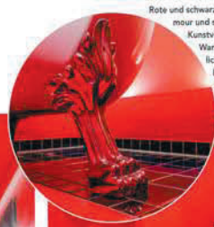
Rote und schwarze Fliesen am Boden sorgen für Glamour und setzen die Badewanne gut in Szene. Kunstvolle FüÙe tragen die frei stehende Wanne. Die Farbe Rot sorgt für eine sinnliche und verführerische Atmosphäre im Badraum. Der Zehnder-Heizkörper an der Wand passt sich farblich den Fliesen an.